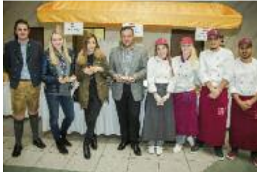
Das Team der Essensausgabe war nicht nur bei Freunden und Nachbarn der Tourismusschule stark frequentiert.

Erwachsenenlehrganges, greift bei der Arbeit in seinen Gastronomiebetrieben gerne auf Praktikanten aus der Tourismusschule zurück. Das macht die Ausbildungsplätze begehrt. Deshalb schnell 0 64 62 / 34 73 anrufen und sich einen Schnuppertag-Termin sichern!