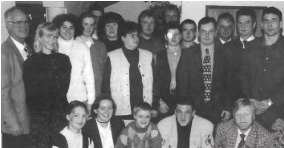
B'hofens Sportlerinnen und Sportler des Jahres 1995

Das war der Aufmacher der BJ-Märzausgabe 1996: