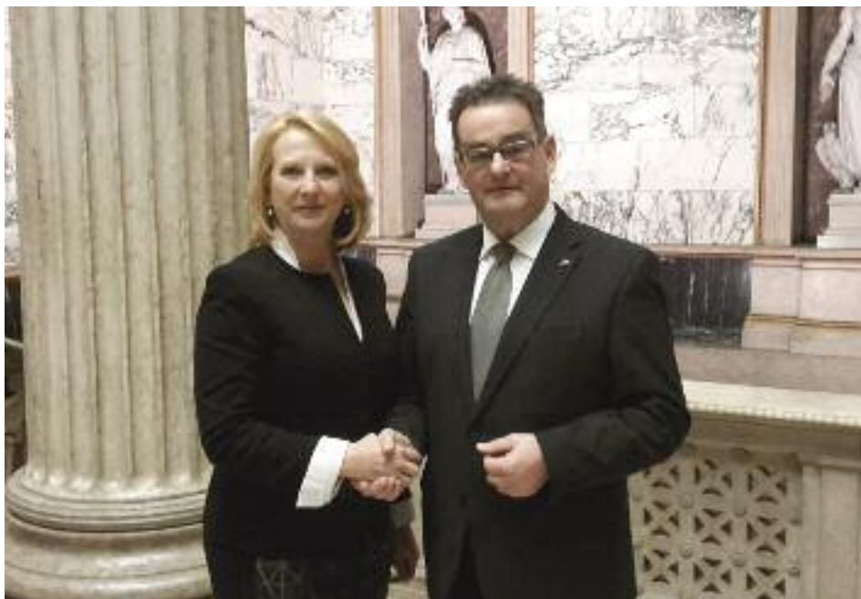
Nationalratspräsidentin Doris Bures und Bundesratspräsident Sepp Saller.

des Seniorenbundes zum 4. Mal wiedergewählt worden, ich werde diese Funktion sicher noch einige Jahre ausüben. Als Bundesrat bin ich bis 2018 angelobt. Allerdings geht jede interessante Zeit einmal zu Ende. Ich möchte mich dazu aber nicht festlegen.