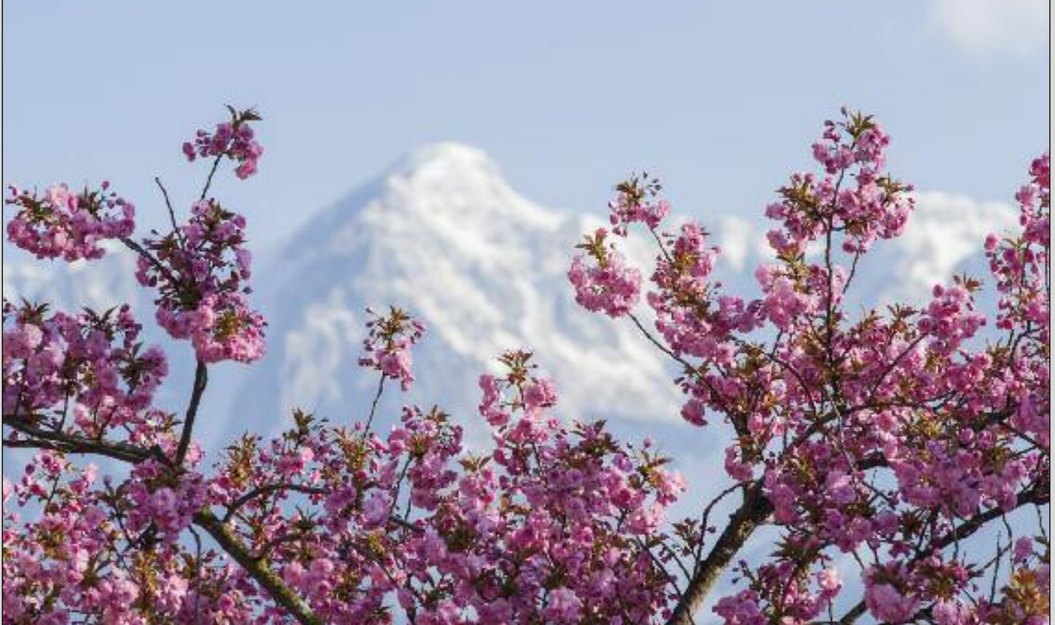
Frühling in Bischofshofen, Spätwinter am Raucheck (2.431 m) im Tennengebirge

Erscheint in Bischofshofen · Mühlbach · Pfarrwerfen · Werfen · Werfenweng · Hüttau · St. Martin