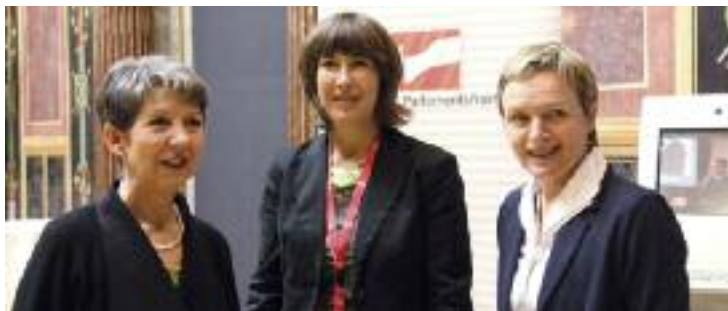
v. li. Präsidentin des Nationalrates Mag. Barbara Prammer, NRin Mag. Christine Lapp und NRin Mag. Rosa Lohfeyer.

und Mandataren des Österreichischen Parlaments für ausführliche Gespräche zur Verfügung. Zahlreiche Interessierte nutzten die Möglichkeit, im direkten Gespräch mit den Abgeordneten aktuelle politische Themen zu diskutieren und den Ort der Gesetzgebung kennenzulernen.