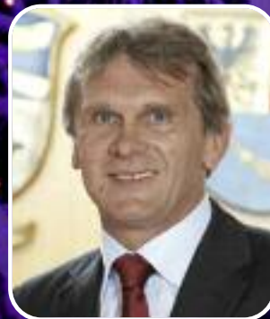
Vizebgm. Werner Schnell Bischofshofen