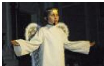
Der Engel verkündet den Hirten die frohe Botschaft.