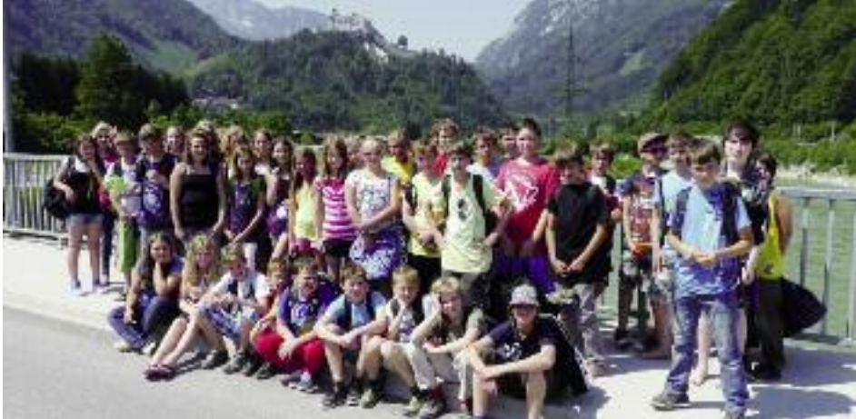
Die Klassen der Hauptschule Werfen und Mittelschule Fridolfing auf der Brücke über die Salzach.

Die Klassen aus Werfen und Fridolfing erhielten hieraus die Anregung für den gemeinsamen Besuch der Eisriesenwelt.