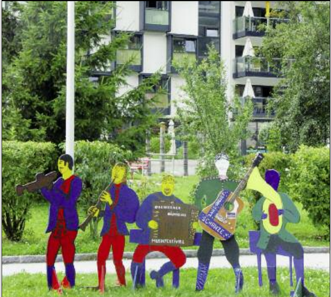
Programm-Highlights für August auf Seite 13.