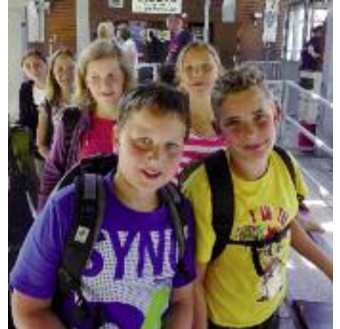
Einige Schülerinnen und Schüler vor der Auffahrt zur Eisriesenwelt.